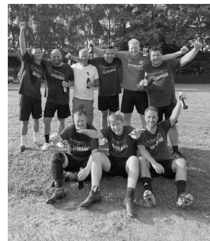
Die Siegermannschaft Hobbyturnier beim Sommerfest des RSV Klüt.